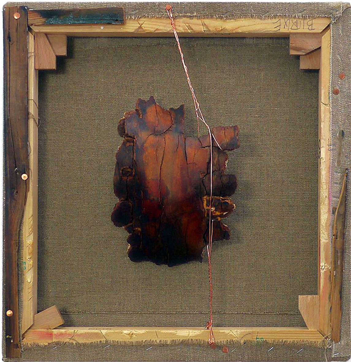
Gehaltener Verfall , 2026 Birkenrinde, Kupfer, Holz auf Leinen, 50 x 50 cm