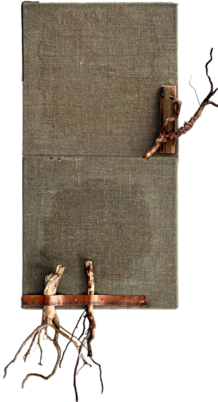
Stumme Zeugen, 2026 Fichtenwurzeln, Kupfer auf Leinen, 75 x 40 x 15 cm