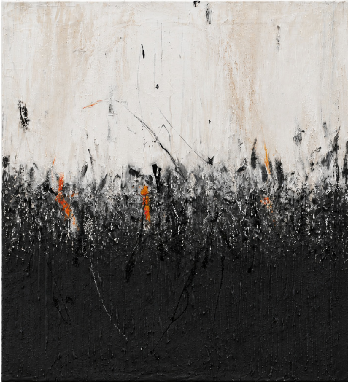
Der greise Kopf , 2004 Strukturpaste, Lackfarbe auf Nessel, 100 x 90 cm

Aus der Serie „Winterreise“ Ausstellungsrelevanz: München 2007, Dessau 2009