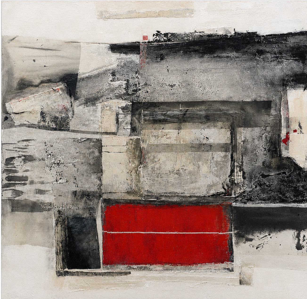
Fukushima, 2017 Acryl, Seide auf Nessel, 140 x 140 cm