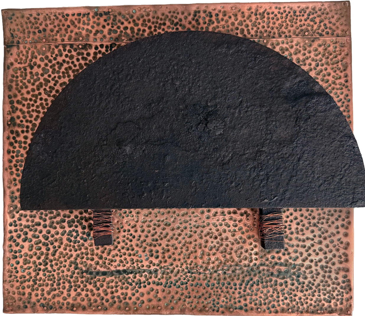
O.T., 1998-2026 Eisen auf Kupfer, 42,5 x 47,5 x 7 cm Aus der Serie „Fragile Strukturen“